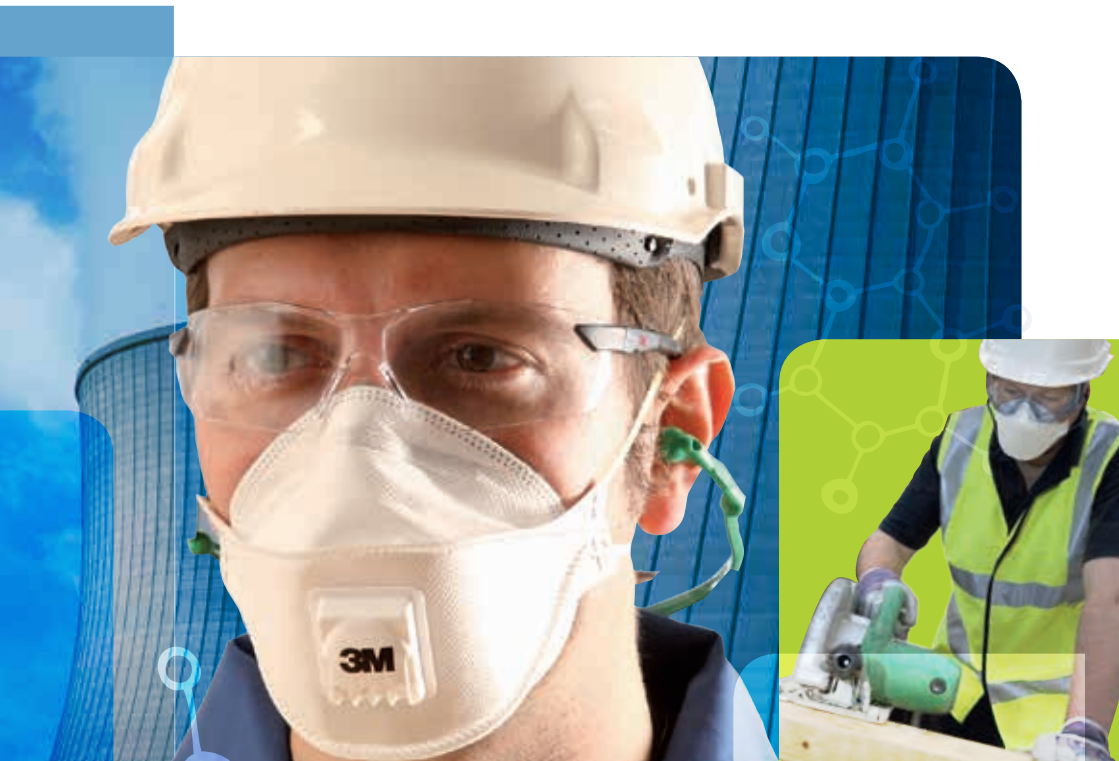
Схема выбора респираторной защиты

3M Средства для обеспечения охраны труда