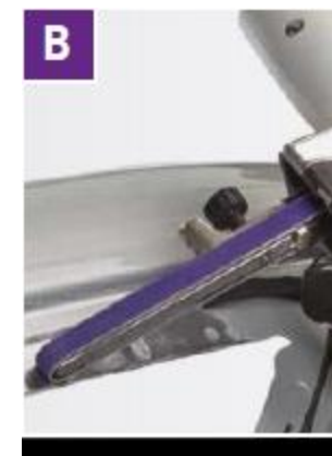
Удаление точечной сварки