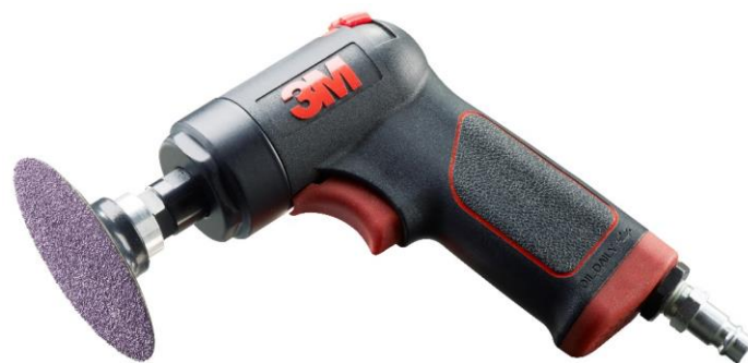
33577 Пневматическая угловая зачистная машинка