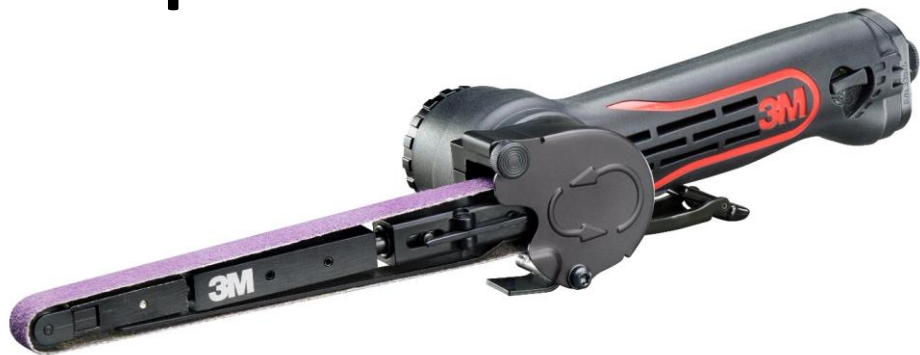
33575 Пневматический шлифовальный напильник для лент 457мм