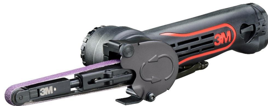
33573 Пневматический шлифовальный напильник для лент 330 мм